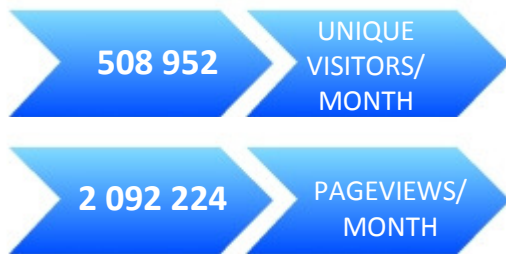
SOURCE: Metriweb, May 2010 Check our latest updates on www.roulartamedia.be

Trendstop.be allows visitors to do a lot of research on the 150.000 biggest companies in Belgium: company analyses, searching contacts, sales statistics, number of employees, benefits,... The site offers a newsletter called. 'On Top' (two times a month) with information for companies on different topics such as finance, taxes, law, marketing, sales & HR.